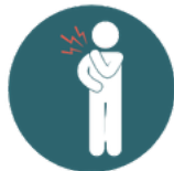
Hyperlaxité articulaire Entorses - luxations - douleurs chroniques